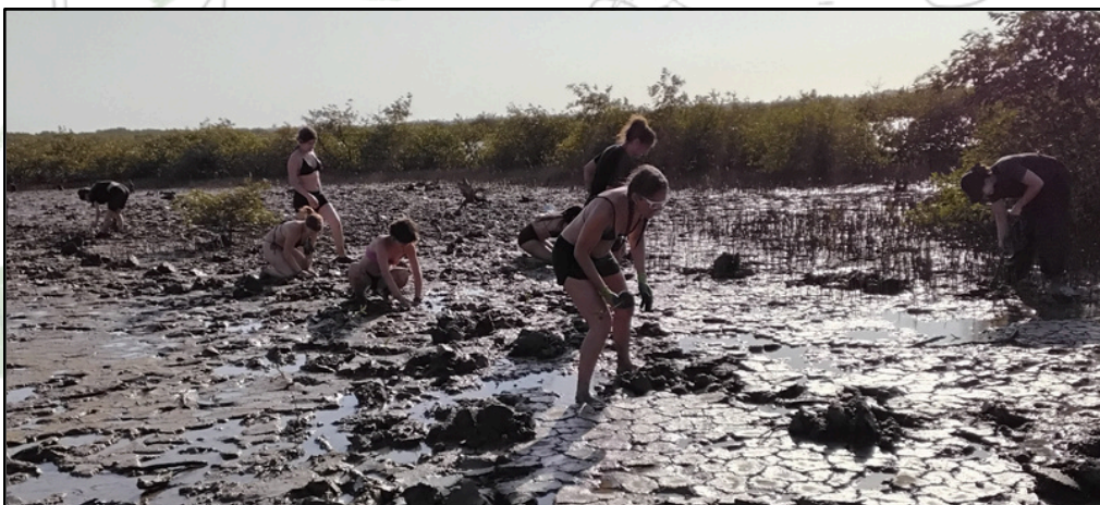
Reboisement de la mangrove en Basse-Casamance