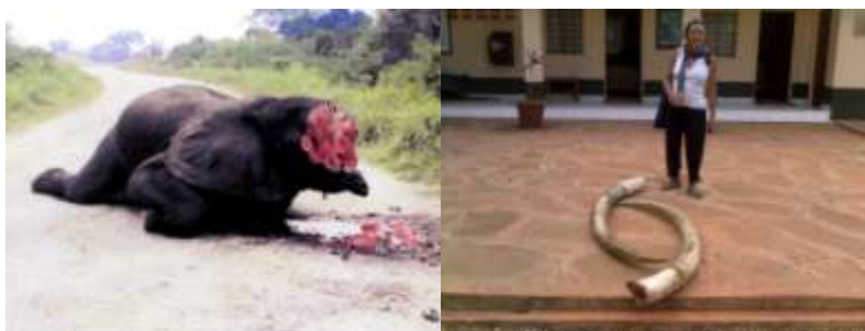
Constat du braconnage, Kenya Wildlife Service/ Sens Afrique, Kwale 2011

Malgré l'interdiction du commerce de l'ivoire il y a 20 ans, chaque jour, plus de 50 éléphants sont encore abattus pour leurs défenses. Ce niveau alarmant de braconnage pourrait conduire à l'extinction de l'éléphant d'Afrique sur presque l'ensemble du continent en 15 ans. La CITES (5) ne doit plus soutenir les ventes uniques d'ivoire, le commerce légal de l'ivoire et les propositions de déclassement des populations d'éléphants mais en revanche, soutenir la proposition du Kenya d'étendre de 9 à 20 ans le "moratoire". En Afrique deux millions d'éléphants vivaient en 1960 aujourd'hui ils sont moins de 400 000. « Le commerce illégal de la faune sauvage, à l'échelle internationale, se classe second derrière le commerce illicite des stupéfiants et des armes. Il est évalué à 20 milliards de dollars par an ». source Interpol Wildlife Crime August 23, 2007