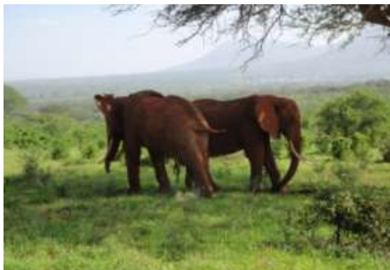
Eléphants du Kenya, Parc Stavo