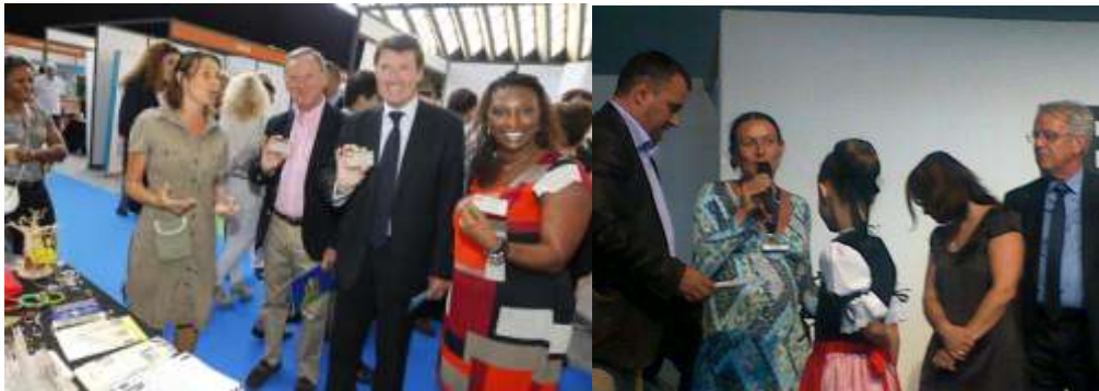
Forum des associations – Parc des expositions Nice

*CUM : Centre Universitaire Méditerranéen- WWF : Worldwilde fund for Nature.