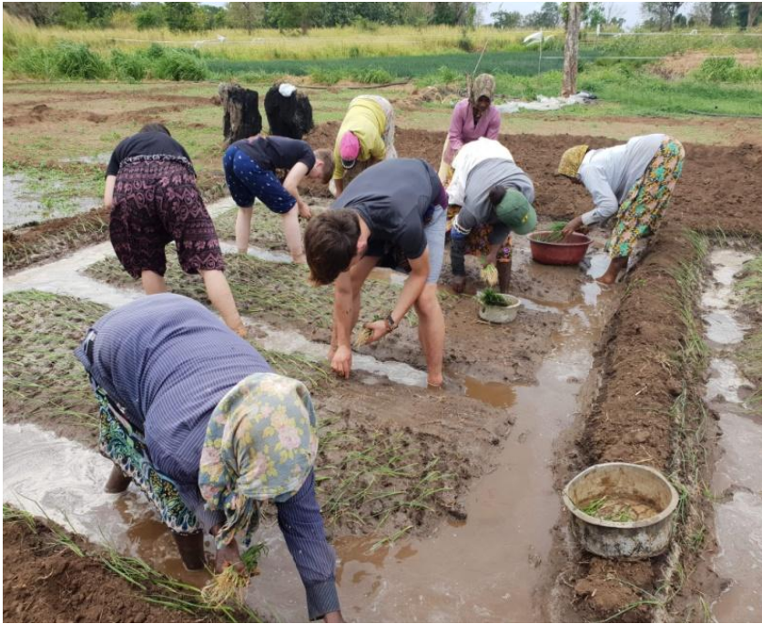
Projet agrobiologique Habarana Sri Lanka

Que la lutte contre les changements climatiques soit le reflet d'équité et de fraternité entre nos peuples !