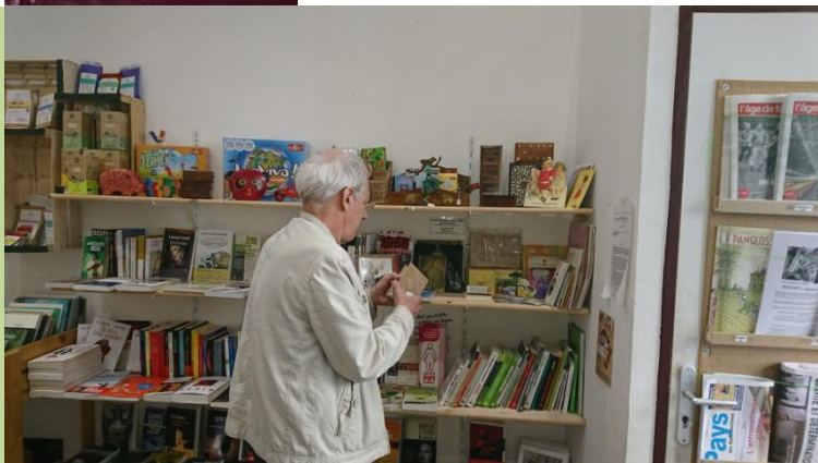
Artisan du Monde, 5 rue Vernier à Nice