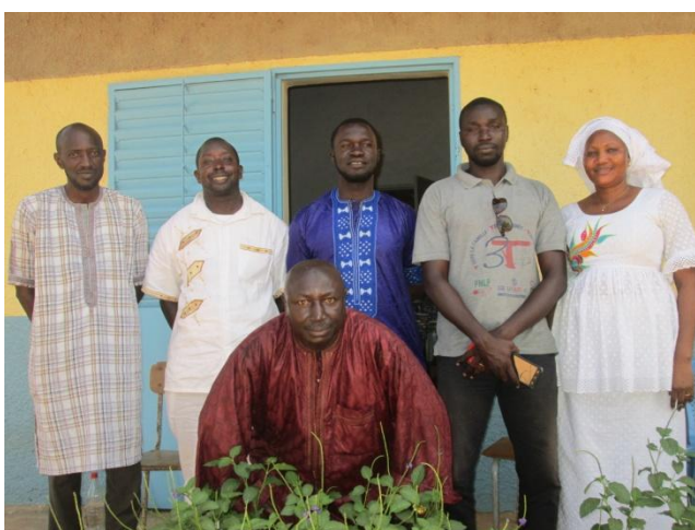
Equipe enseignante Ziguinchor Sénégal

Monde » : Il est dorénavant acquis que nous, citoyens des pays industrialisés, sommes responsables de la dégradation de notre environnement à l'échelle planétaire. Un rapport scientifique constate que les pays développés sont à la cause de plus de 30% de la perte de la biodiversité dans les pays du Sud. Pourtant les connaissances et les méthodes de gestion traditionnelles des communautés locales des PVD sont essentielles à la conservation et à l'utilisation durable de la biodiversité. A travers nos outils pédagogiques, une majorité des élèves ont saisi l'importance de changer de comportement afin de préserver et de partager de manière plus équitable les ressources naturelles, ce sont de réels éco-citoyens. A travers les correspondances scolaires, les apprentissages se font dans les 2 sens !