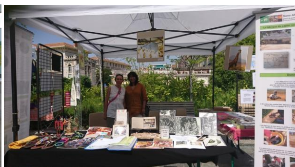
Nice fête l'Afrique juin 2018