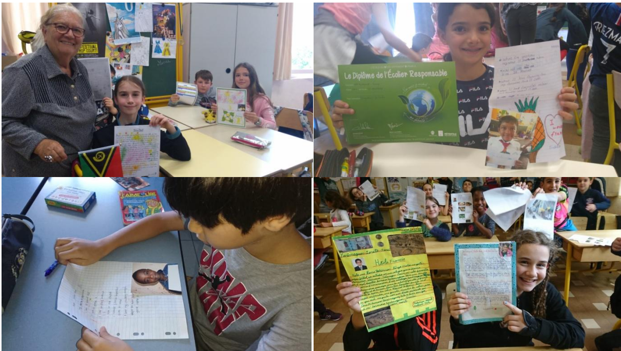
Échanges avec le Vanuatu, l'Amazonie, le Sri Lanka, la Côte d'Ivoire

Impact du projet : Même si les activités d'éducation à l'environnement y sont prépondérantes, notre module est véritablement transdisciplinaire (langue étrangère, géographie, histoire, découverte du monde, science du vivant, traditions, art, sociologie...). D'où l'importance pour les professeurs de favoriser la rédaction en français ou anglais/espagnol dans une démarche d'investigation de l'élève. Les recommandations n'apparaissent plus comme un discours d'adulte mais comme une nécessité, pour découvrir l'autre, échanger, comprendre le monde vivant qui les entoure. Grâce à nos outils, nous poursuivons l'approfondissement des thématiques transversales tels que ; la notion de solidarité avec les collectes scolaires, la consommation responsable pour freiner le gâchis, découvrir les énergies alternatives, le tri des déchets pour freiner la pollution, maintenir la biodiversité et surtout gageur d'une bonne santé. Cela permet aussi de faire collaborer des établissements scolaires de pays différents autour d'un projet commun, objectif apprécié par l'inspection académique. Nos volontaires à l'international interviennent dans les classes étrangères pour assurer les échanges. Aujourd'hui nous modélisons un concept pour que les écoles d'ici et de là-bas puissent correspondre plus régulièrement grâce aux nouvelles technologies.