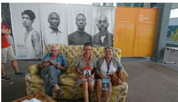
Marseille exposition interactive « Né quelque part » nov.18