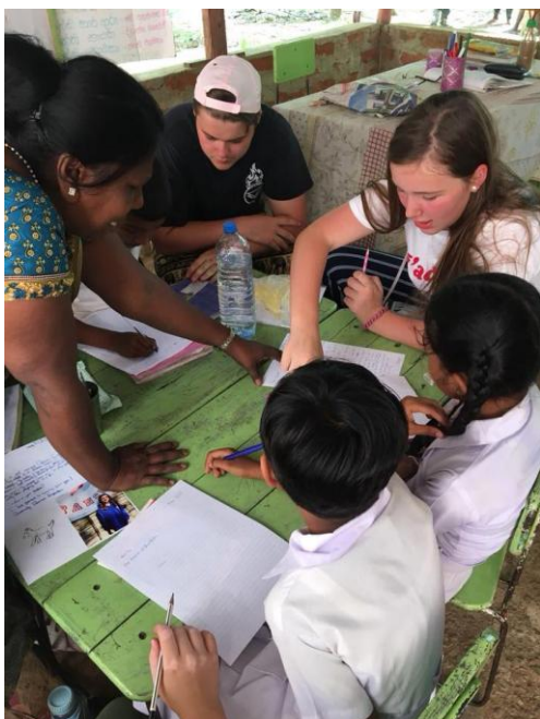
Echanges scolaires entre les élèves niçois et Sri lankais

Nous répondons à la demande grandissante des établissements scolaires concernant l'éducation au développement durable. Les équipes enseignantes sont motivées par cet apprentissage transversal aux matières enseignées avec une dimension internationale mais n'ont pas souvent le temps de le mettre en place. Notre collaboration est un appui précieux. Toutes nos interventions pédagogiques sont accompagnées d'exemples concrets de projets d'aide au développement que nous menons sur le terrain avec l'aide de nos volontaires à l'international.