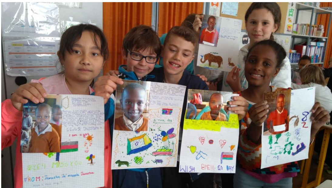
Correspondants Ecole de Cimiez Nice avec le Kenya 2018