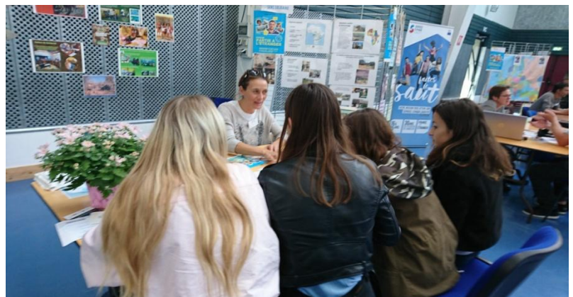
Salon des métiers de l'humanitaire, octobre 2018

Conférences/ateliers de sensibilisation sur l'aide au développement : informer un public désireux de connaître le secteur de l'humanitaire, ses enjeux politiques et comment s'engager à nos côtés dans nos missions de Solidarité Internationale pour la protection de l'Environnement.