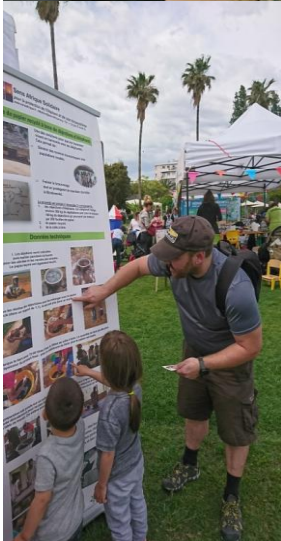
Stand au Parc Phoenix