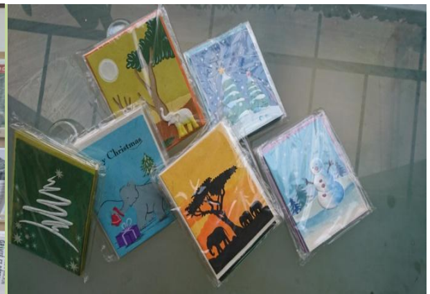
Produits cartes de vœux de la Fabrique du Sri Lanka