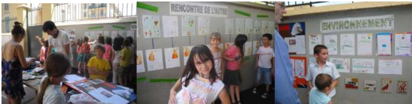
Montage et Exposition à l'école du Port

Le projet rencontre un vif enthousiasme de la part des élèves. Le corps enseignant et les parents d'élèves ont déjà pris part positivement au projet avec comme levier la collecte de fournitures scolaires pour le Kenya . Pour capitaliser et témoigner les travaux de chacun, nous mettons en place une exposition début juin à l'école en fusionnant les productions des six établissements. Ce travail collectif de communication est un apprentissage pour les scolaires. Sa durée se fera sur plusieurs jours afin de gérer convenablement la logistique et sa visibilité auprès d'un large public. Avec les enseignants nous parlons déjà de l'organisation de bus pour rassembler les élèves et leurs parents pour le vernissage.