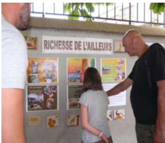
Exposition correspondance école du Port

L'association Sens Afrique solidaire « SAS » est une association d'intérêt générale ayant pour objet la réalisation d'actions de solidarité internationale dont l'objectif est de préserver l'environnement . Pour atteindre son but les moyens d'actions sont : - L'éducation à la conservation de la diversité biologique. - Le soutien à la gestion des ressources dans le cadre du développement durable. - la mise en œuvre d'actions de solidarité internationale et de projets générateurs de revenus pour les populations locales. - Le développement de liens interculturels entre le nord et le sud.